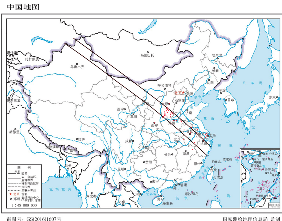
图 2 嘉靖廿一年七月朔日食

图2给出这些地方志记载日全食的地点,双红线是天文计算得到的全食带,红点是记录地点.